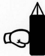
الف) برخورد دست با کیسه بوکس

کنش = نیروی ماشین به درخت واکنش = نیروی درخت به ماشین